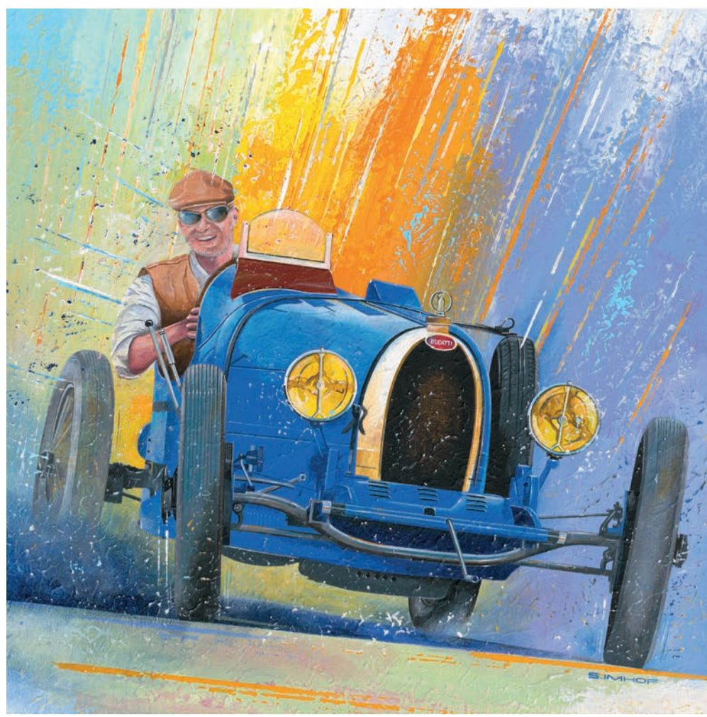
II. Ausgabe 26.-28. August 2022